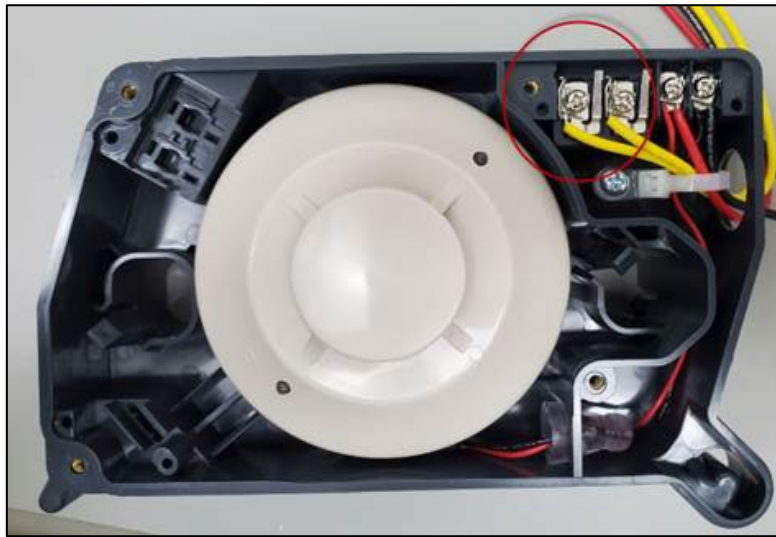
Figure 1. Détecteur de fumée

Si le détecteur de fumée D4120 affiche une DEL orange fixe, c'est l'indication que le couvercle est manquant ou mal fixé.